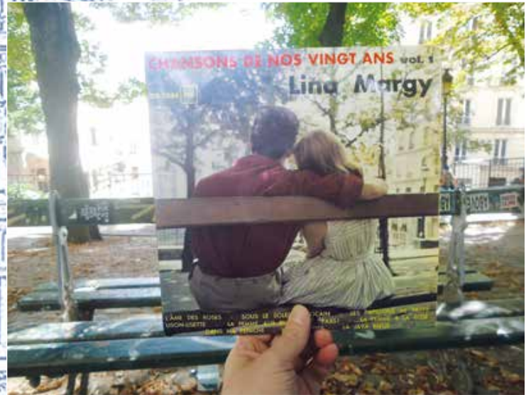
1967 - Lina Margy : Chansons De Nos Vingt Ans (Philips) Que sont devenus ces amoureux ? Si Lina Margy choisit la place Emile-Goudeau, ex-place Ravignan, c'est parce que depuis les années 1930 elle chante le Paname de la Butte.