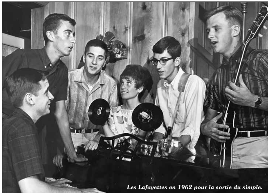
Les Lafayettees en 1962 pour la sortie du simple.

Le temps d'un seul super 45 tours, regroupant l'intégrale de leur discographie RCA Victor, les Lafayettees sont devenus un groupe-culte, et la France ne fait pas exception. Retour sur leur parcours intrigant par Thierry Liesenfeld.