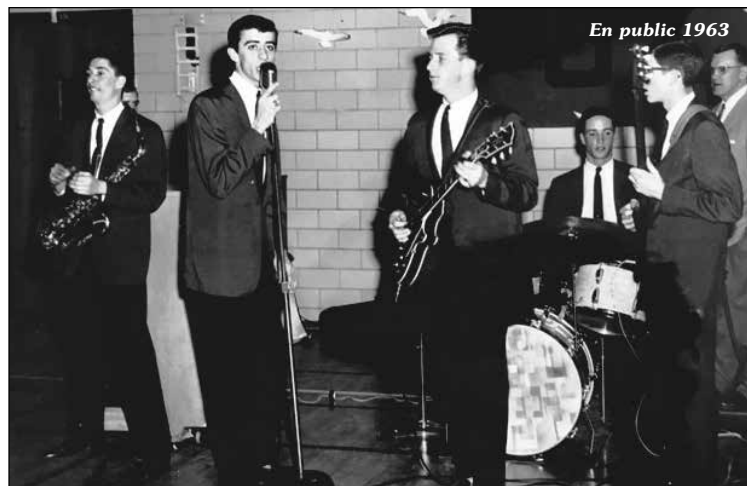
En public 1963