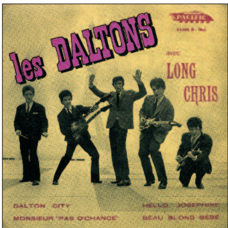
En mars 1962, premier et rare super 45 tours des Daltons avec Long Chris, sur Pacific.