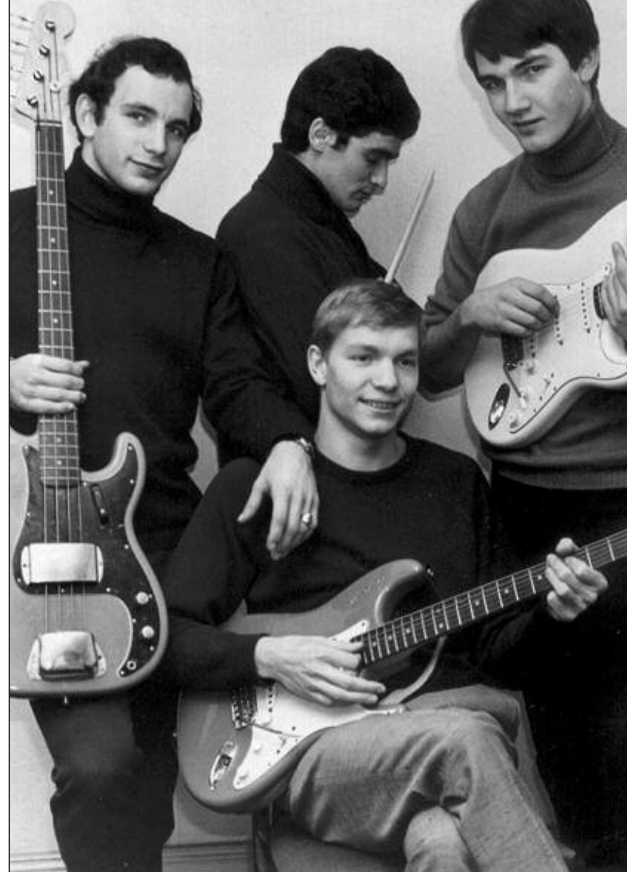
Pionniers du rock de l'Est dès 1963 avec un premier disque, les Klébers en 1965.

qui vont se saigner à vif et prendre le crédit nécessaire. On promet de leur rendre quand on sera célèbre, ça ne va pas tarder, on a déjà fait les photos de groupe et le père du soliste travaille à la mairie. On aura des subventions, des contrats... et même le nom dans le journal. Je crois qu'on peut de cette façon généraliser quant à la présence de l'un ou l'autre des candidats dans chaque formation. Parfois c'était aussi