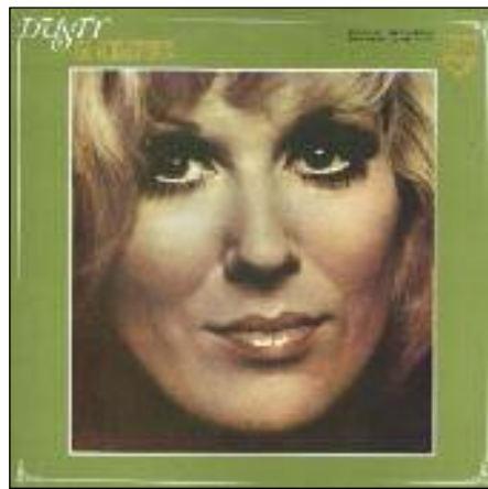
En 1969, 30 cm « Dusty (Springfield) In Memphis ».

1969 - SP 326 972 - Dusty Springfield : Windmills Of Your Mind. L'ingénieur du son Tom Dowd rajoute quelques mesures à la partition de Michel Legrand pour le célèbre thème du film « L'Affaire