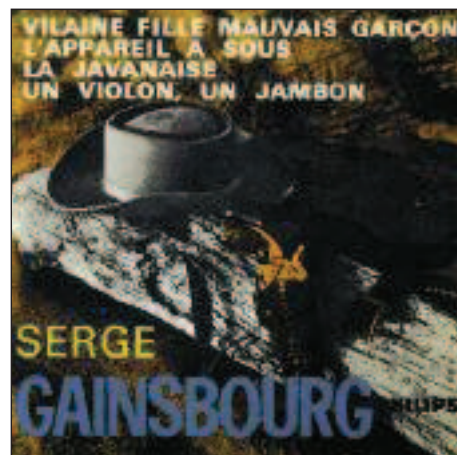
Deuxième pochette de « La Javanaise » par son auteur, début 1963.