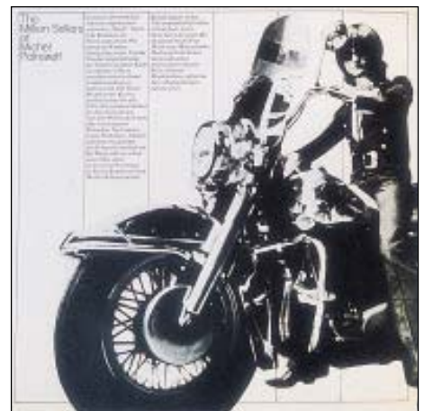
1970 - MICHEL POLNAREFF : The Million Sellers Of.

mata, présente la même photo des deux côtés de la pochette. La moto a été construite par Maurice Combalbert qui a également travaillé sur celles de Johnny Hallyday.