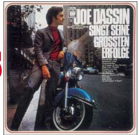
1968 - BRIGITTE BARDOT : Harley-Davidson. SP Fermata FB-33265 Brésil.

Le 33 tours français de Joe Dassin « A New York » est sorti outre-Rhin avec la même pochette (au recto seulement, celle-ci ne s'ouvrant pas comme chez nous) et les mêmes morceaux, rebaptisé « Singt Seine Grossten Erfolge » (titre légèrement mensonger). On y voit Joe, dans une rue de New York, costume gris et col roulé rouge, son éternel petit cigare à la main, accoudé sur le guidon d'une Duo-Glide de presse (autocollant NBC news sur le pare-brise, flouté sur l'édition française). Une pose différente, en noir et blanc, orne le simple allemand « Ma Bonne Etoile »/« Un Peu Comme Toi ».