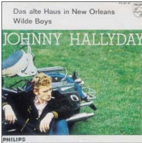
1964 - JOHNNY HALLYDAY : Das Alte Haus in New Orleans/ Wilde Boys. SP Philips 373 465 BF Allemagne.

A tout seigneur, tout honneur. Dès 1962, Johnny Hallyday adopte la Harley et ne l'a jamais abandonnée pendant plus de quarante ans, malgré quelques infidélités : Norton sur le super 45 tours « A Tout Casser » en 1968, Kawasaki sur le simple « Johnny Rider »/« Le Bol D'Or » en 1974 et Triumph sur l'album « En Pièces Détachées » en 1981. En 1964, Johnny, la cigarette aux lèvres, assis dans l'herbe devant une Harley, pose pour cette photo (inversée) qui illustre le simple allemand où il interprète, dans cette langue, « Le Pénitencier » et « Les Mauvais Garçons », enregistrés les 8 et 9 novembre 1964. Ce cliché, toujours inversé, est utilisé par Bear Family pour l'album « Triff Die Rattles », en 1984, reprenant l'ensemble des morceaux chantés en allemand par Johnny Hallyday. La photo originale est celle du super 45 tours français « Les Mauvais Garçons », que l'on retrouve sur l'équivalent espagnol, « Jovenes Malos », avec les titres traduits.